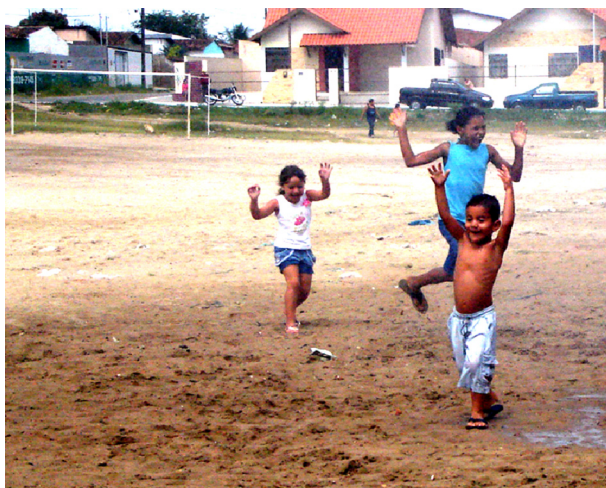
Imagem 04: Crianças brincando: a ambivalência do riso.

Considerando importante essa troca de experiências da criança, acreditamos que a escola possui uma função social e pedagógica no sentido de reconhecer o cotidiano lúdico e transformá-lo em conhecimento que forme, eduque a criança para o lazer numa perspectiva de desenvolvimento humano.